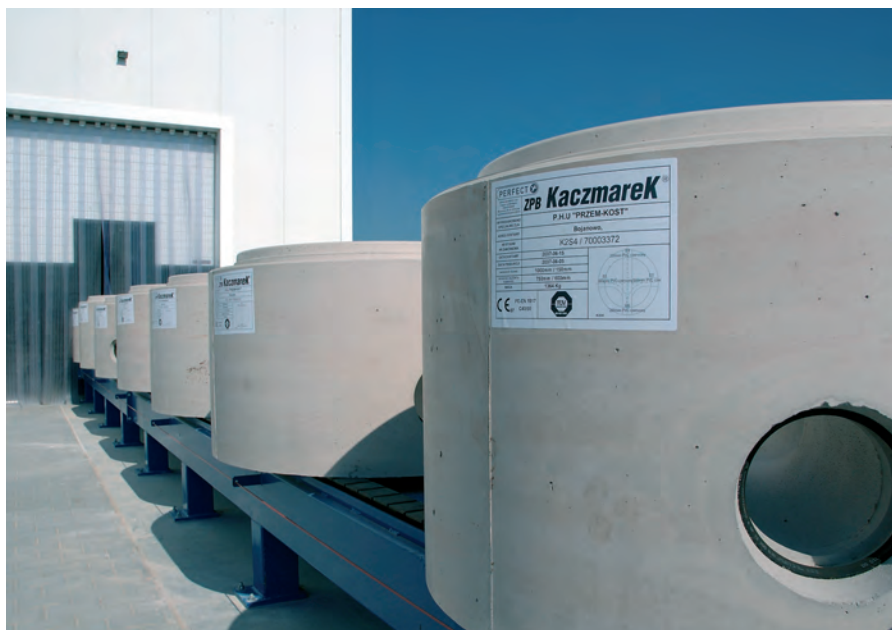
Маркировка каждого индивидуального кольца с дном способствует общей логистике – вплоть до установки на строительной площадке

стве других шахтных компонентов опирается на самое высокое качество. Предприятие ZPB Kaczmarek первым и единственным в Польше начало произ-