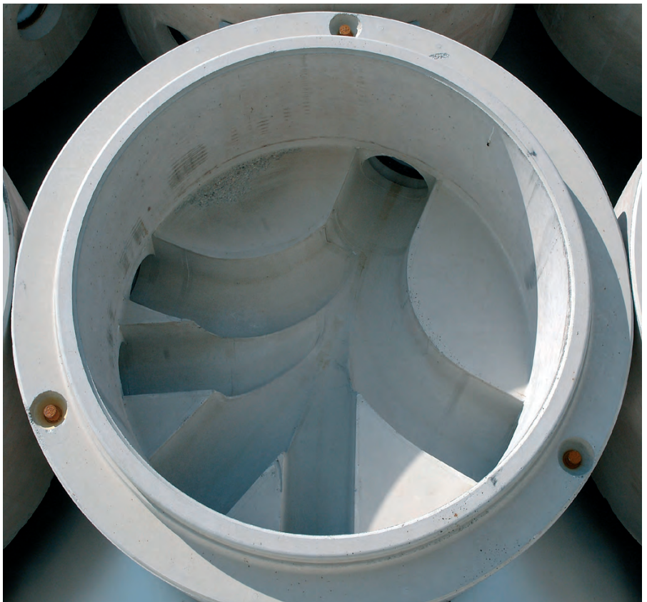
Монолитно и индивидуально – водоводы всегда точно соответствуют требованиям проекта