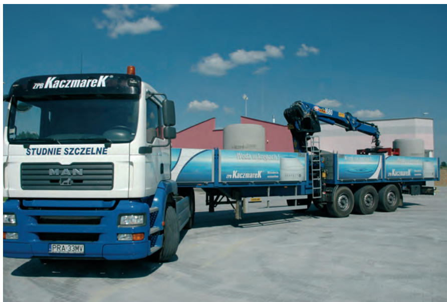
Также и парк подвижного состава был перевооружен - в соответствии с требованиями ультрасовременного производства