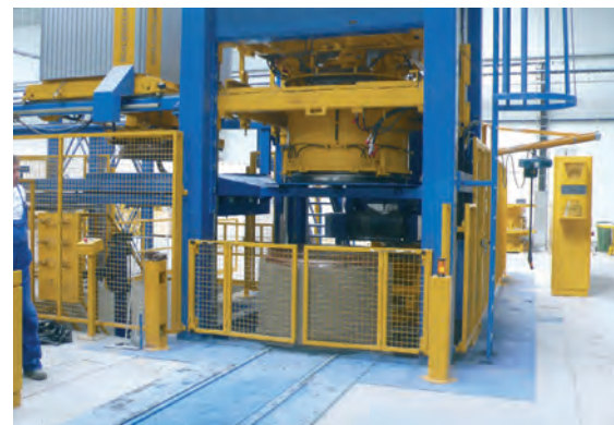
В эксплуатации Exact 1500 – полностью автоматизированная технологическая линия для выпуска шахтных элементов с поддонами и верхними муфтами

водство шахтных колец диаметрами 1000 и 1200 мм с использованием верхних муфт Exact. Благодаря использованию этих муфт, которые остаются на