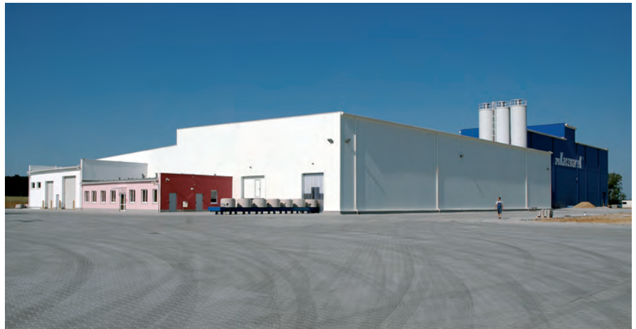
Новый завод фирмы ZPB Kaczmarek в Prusice – на переднем плане конвейер подачи на склад системы изготовления Perfect

Наряду с системой изготовления Perfect, где осуществляется выпуск колец с днищем диаметром 1000 мм с толщиной стенки 150 мм и диаметром 1200 мм с толщиной стенки до 230 мм, фирма ZPB Kaczmarek также при производ-