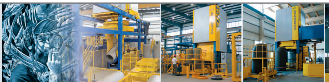
EXACT 2500 производство труб