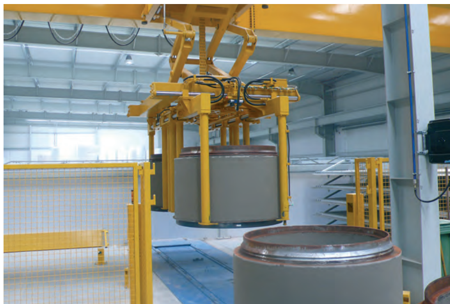
Эффективный и надежный хандлинг продуктов с помощью крана-робота Transexact

построенных колодцев. Используя новые, современные продукты, мы в будущем исключаем колоссальные затраты на доделку или последующую замену шахты.