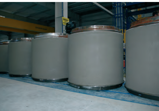
Шахтное кольцо – изготовленное с использованием поддонов и верхних муфт – для высочайшей точности и устойчивости общей конструкции